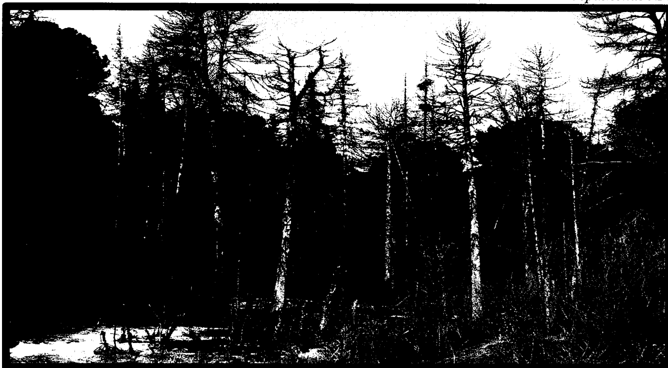
Изображение № 4 Сухостойное дерево. Не является валежником Изображение № 5

Кроме того, необходимо обратить внимание, что деревья, которые лежат на земле, но не имеют признаков естественного отмирания (имеют зеленую листву или хвою), определять как «мертвые» не допускается ( смотри изображение № 5 ).