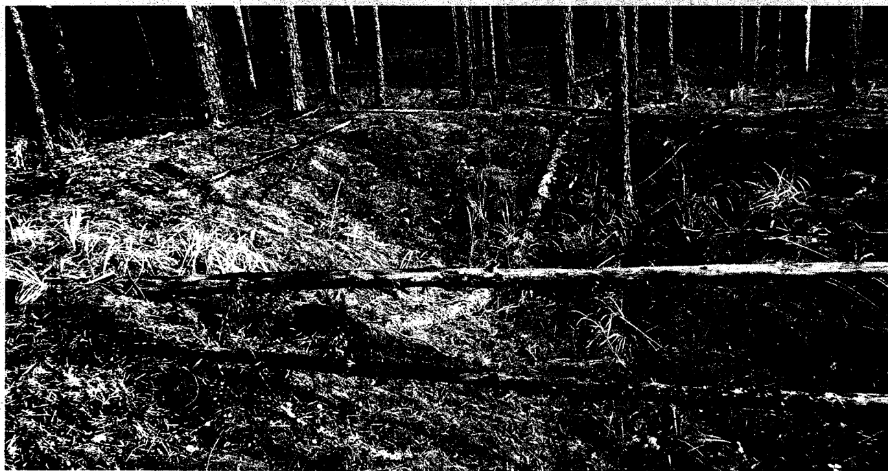
Изображение № 1 Валежник

Примеры валежника (смотри изображения №№ 1,2,3).