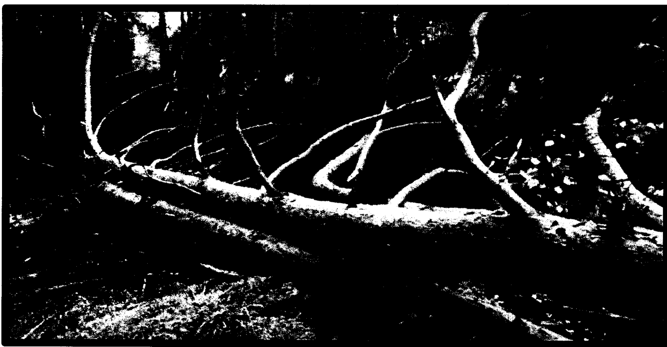
Лежащее на поверхности земли ветровальное дерево, не имеющее признаков отмирания. Не является валежником

Кроме того, необходимо обратить внимание, что деревья, которые лежат на земле, но не имеют признаков естественного отмирания (имеют зеленую листву или хвою), определять как «мертвые» не допускается ( смотри изображение № 5 ).